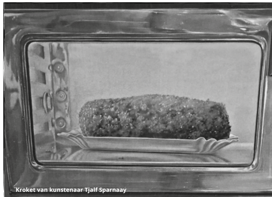
Kroket van kunstenaar Tjalf Sparnaay

Het definitief ontwerp is in 2015 besproken in de welstandscommissie en in de monumentencommissie. Medio 2016 wordt dit project naar verwachting gerealiseerd. Over het gebruik van de afbeelding van een kroket is overeenstemming bereikt met de beeldend kunstenaar Tjalf Sparnaay.