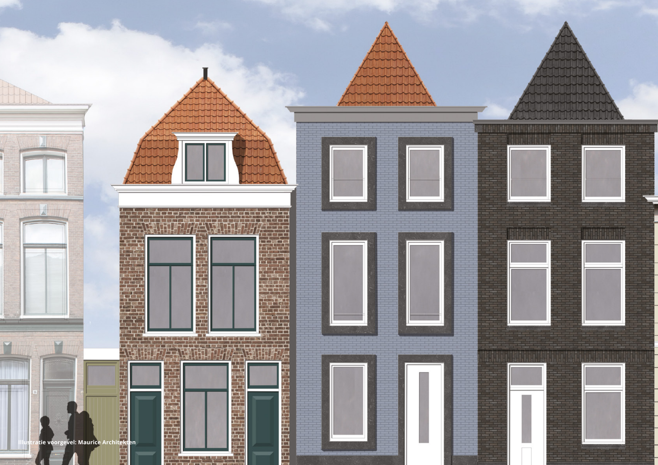
Illustratie voorgevel: Maurice Architecten