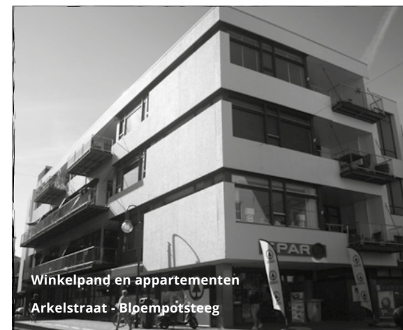
Winkelpand en appartementen Arkelstraat - Bloempotsteeg