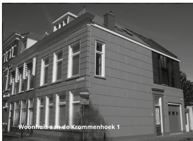
Woonhuis aan de Krommenhoek 1