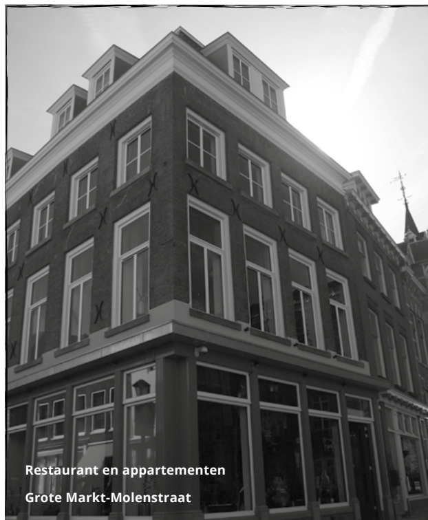
Restaurant en appartementen Grote Markt-Molenstraat