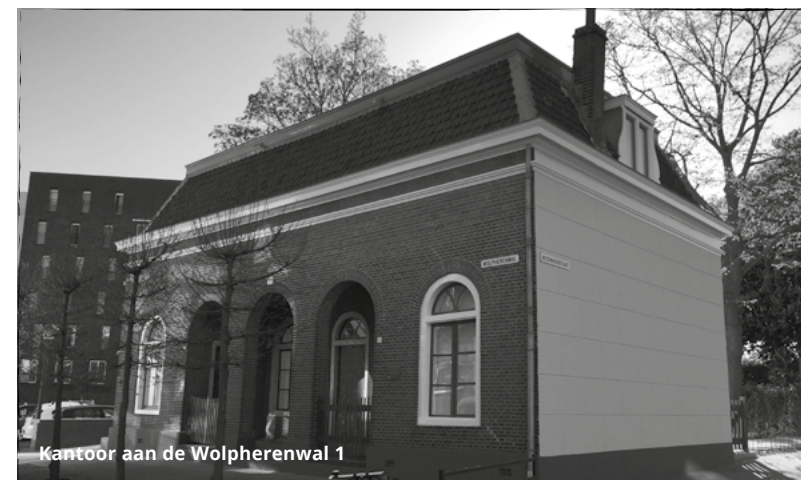
Kantoor aan de Wolpherenwal 1