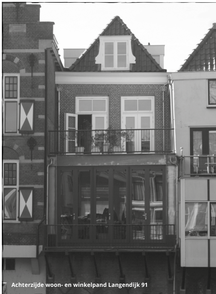
Achterzijde woon- en winkelpand Langendijk 91