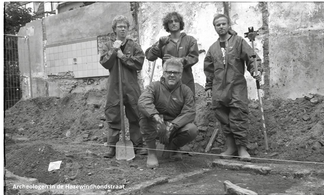
Archeologen in de Hazewindhondstraat

Uit het voorlopige rapport van Hollandia: "Er zijn binnen het onderzoeksgebied archeologische resten uit de late middeleeuwen tot en met de nieuwe tijd aangetroffen. De archeologische resten uit de late middeleeuwen bestaan uit een stadsmuur en een opgebracht zandig kleipakket, met daarin aardewerk uit de 15e eeuw. Als de stadsmuur wordt afgebroken omstreeks 1580 en tot ca. 1750 verschijnt er een structuur, waarvan door het ontbreken van historische kaarten de precieze functie onduidelijk is. De grens van deze structuur zal in de 18e en 19e eeuw een perceelgrens worden, waar twee woonhuizen op komen. Van de woonhuizen zijn muurwerken, vloeren, kelders en een aspot aangetroffen. Ook is huishoudelijk afval aanwezig."