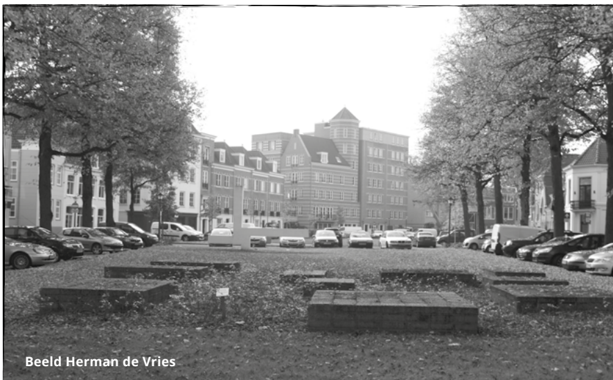
Beeld Herman de Vries

Sommige beelden in de openbare ruimte waren aan een onderhoudsbeurt toe, zoals het beeld van herman de vries op de Kalkhaven. Tot onze vreugde is de gemeente in 2014 gestart met de vernieuwing van het voegwerk. Ook zijn er weer rozen geplaatst, zoals aangegeven door de kunstenaar. Op het Symposium 2015 kon er echt van dit weer opgeknapte beeld genoten worden.